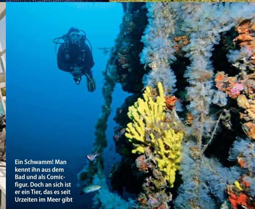
Ein Schwamm! Man kennt ihn aus dem Bad und als Comicfigur. Doch an sich ist er ein Tier, das es seit Urzeiten im Meer gibt