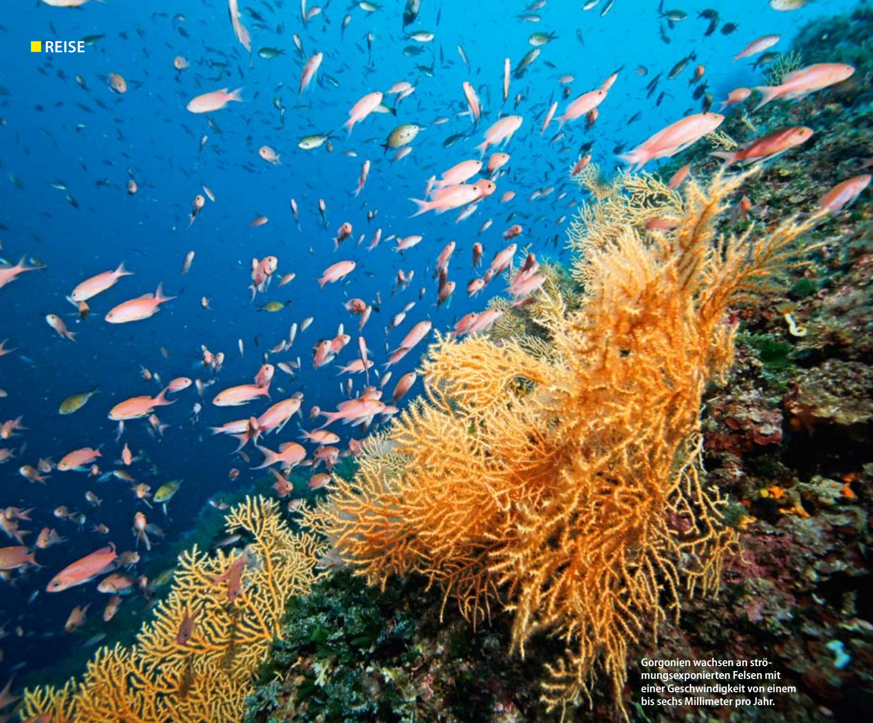
Gorgonien wachsen an strömungsexponierten Felsen mit einer Geschwindigkeit von einem bis sechs Millimeter pro Jahr.